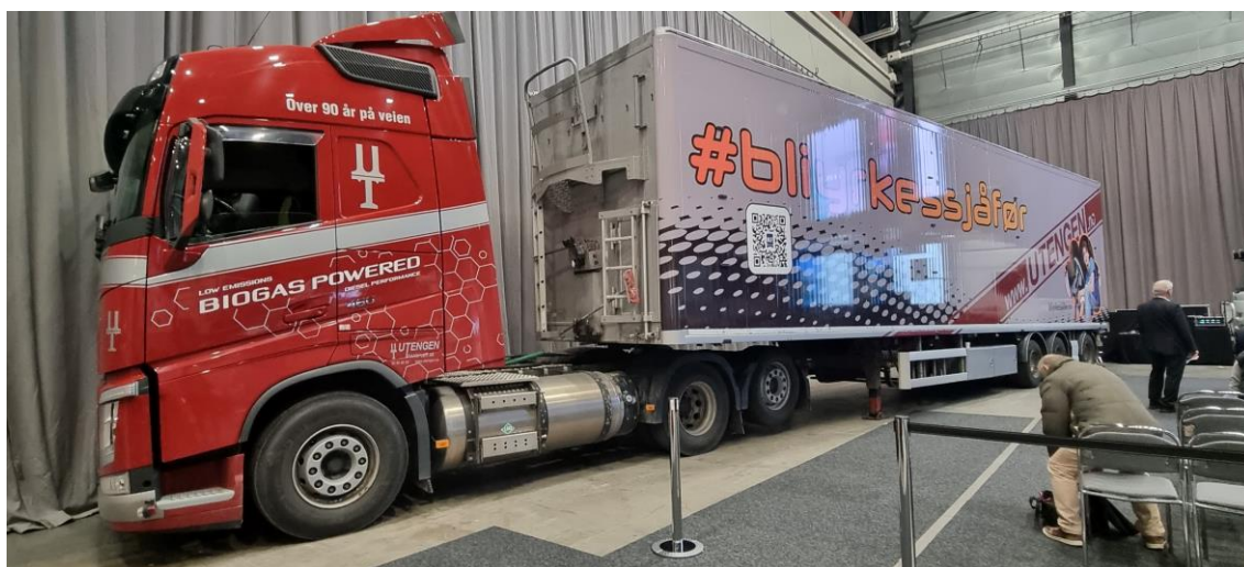
Utengen Transport prydet konferansehallen med biogassbil og henger med rekrutteringsbudskap