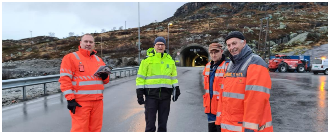
Fra Statens vegvesen og NLF sin «vintervettkampanje» på Haukelifjell i fjor høst

Forventningen er stor blant mange om at forsøkene med tungbilkolonner skal gi den effekt det har vært håp om. Lastebiler har bedre forutsetninger for å ta seg frem enn mindre kjøretøy, men det vil forutsette stor grad av bevissthet og disiplin blant sjåførene.