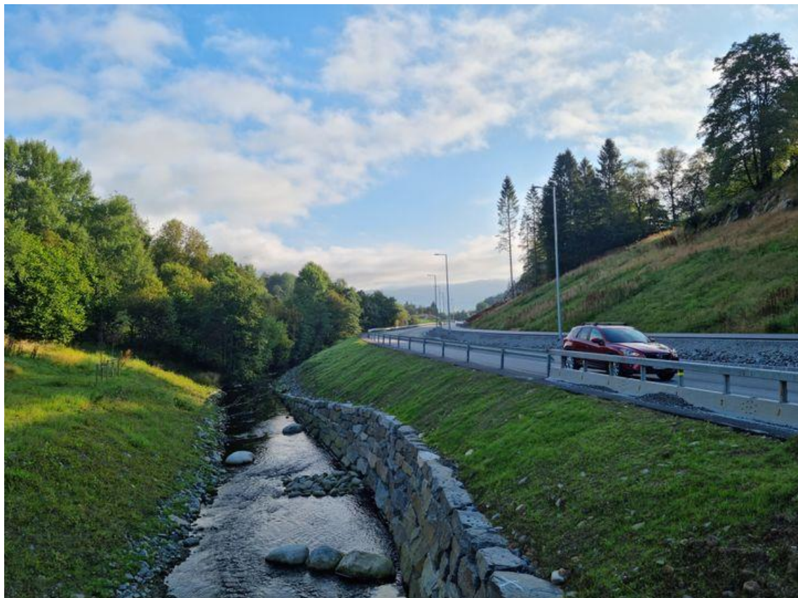
E134 Espelandssvingane.

Espelandssvingane vert gjennomsnittleg trafikkert at 4.864 køyretøy i døgnet. Det er dette som vert kalla årstdøgnstrafikk (ÅDT). Det er mykje næringsverksemd i området. Lange køyretøy utgjer 17 prosent – eller 827 køyretøy – av trafikken.